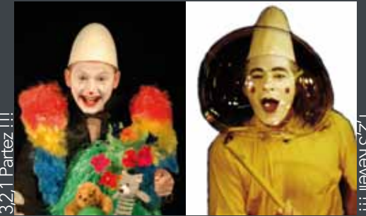
3,2,1 Partez !!!

Equivog Théâtre d'Aventure naît en 1985. Elle accorde dès ses débuts une importance particulière au langage du décor et des accessoires. Sans le savoir, le quotidien camoufle l'extraordinaire. Il suffit d'ouvrir les yeux ! Depuis quelques années Equivog a ajouté une autre corde à son arc avec le travail du clown. D'abord expérimenté avec les tout petits, elle en fait profiter les plus grands avec des reprises de classiques pour les rapprocher de notre quotidien. Une dizaine de comédiens à votre service pour présenter nos spectacles, lectures ou encore encadrer des stages... Ils n'ont qu'un seul but ; illuminer vos sens, éclaircir vos pensées et chatouiller vos zygomatiques. Equivog Théâtre d'Aventure crée le Théâtre des Chartreux en 2009 et en profite pour y présenter ses propres spectacles. Elle s'ouvre également aux compagnies «STF» (Sans Théâtre Fixe) et leur permet ainsi de travailler dans de bonnes conditions. En résumé Equivog Théâtre d'Aventure c'est une grande expérience de tous les publics, et une volonté insubmersible de garder le cap malgré le vent contraire.