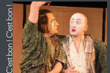
C'est bon ! C'est bon !