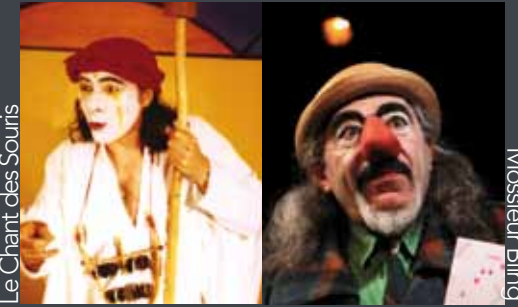
Le Chant des Souris