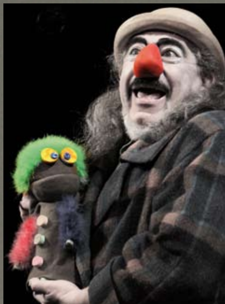
BLING ET PROFESSOR COLOR

▲ Depuis toujours utiliser la création plastique est un élément capital pour les spectacles : Depuis les décors réalistes poussant dans leur retranchement les lois de la perspective du théâtre classique jusqu'aux décors constructivistes des russes en passant par les toiles de fond des cubistes.